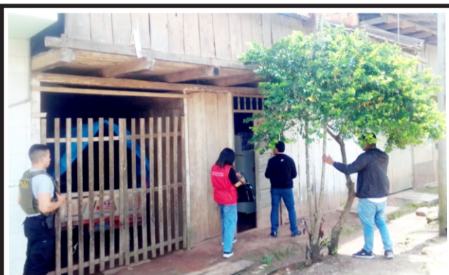
En Jepelacio le dan siete meses de prisión preventiva