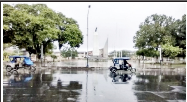
Temperatura nocturna en la selva bajará a 15 grados