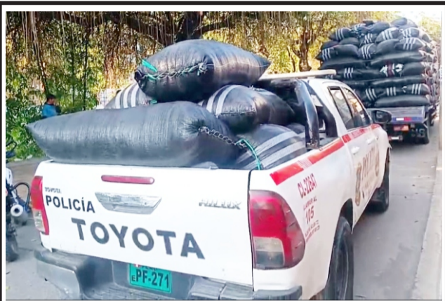
Después de ser robados en carretera de Amazonas