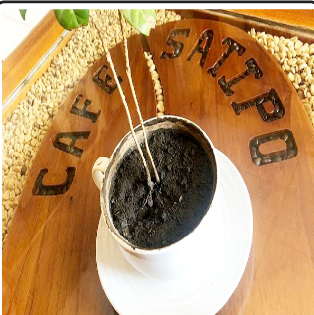
Organiza concurso regional "Rumbo a la Taza de Excelencia"