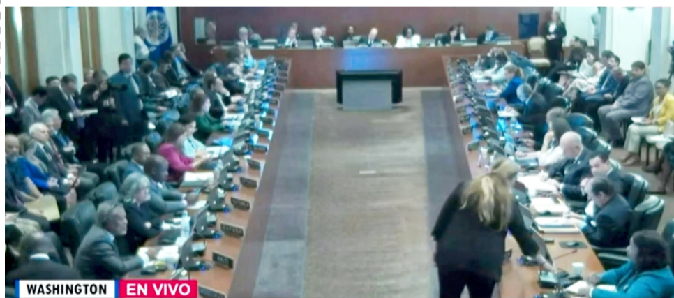
WASHINGTON EN VIVO