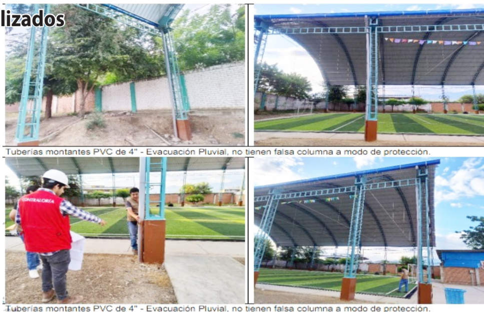
Tuberías montantes PVC de 4" - Evacuación Pluvial, no tienen falsa columna a modo de protección.

suras en el concreto de las veredas de circulación ubicadas al ingreso de la losa deportiva y al costado del módulo de aula existente". Existe fisuras y desnivel en las losas de concreto. Del mismo modo hay desprendimiento y acolchonado de las juntas asfálticas de losa de concreto y en las juntas asfálticas de la cuneta de drenaje pluvial". Otro de los problemas es que, las cunetas de drenaje pluvial, presentan salitre en sardinel interior de su estructura. La Contraloría reveló que existen trabajos contemplados en el expediente técnico de obra, pero no fueron ejecutados en su totalidad, situación que no fue advertido por el supervisor y la entidad durante la recepción de la