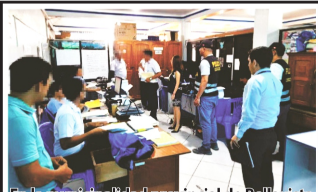
En la municipalidad provincial de Bellavista