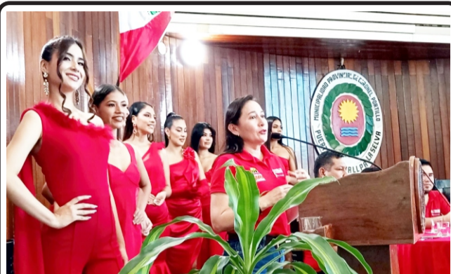
Semana Jubilar 2024