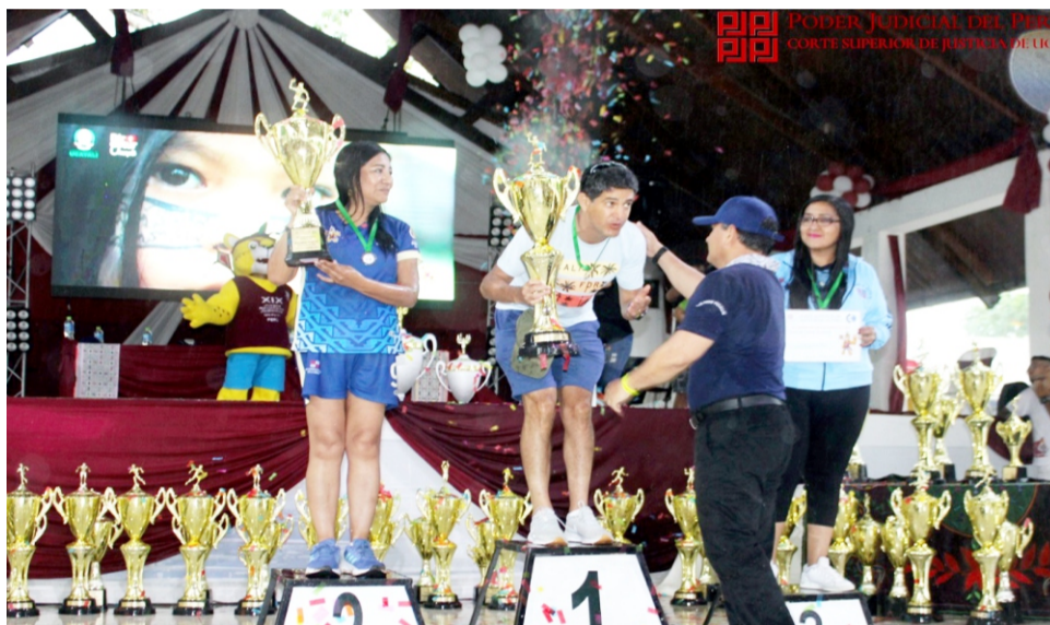
La Corte Superior de Justicia de Ucayali, formará parte de