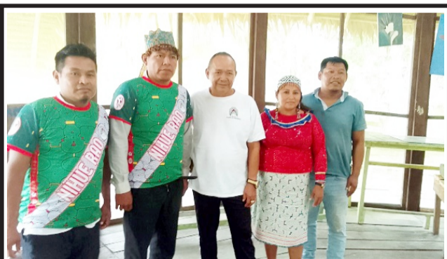
Municipalidad autoriza utilizar el estadio