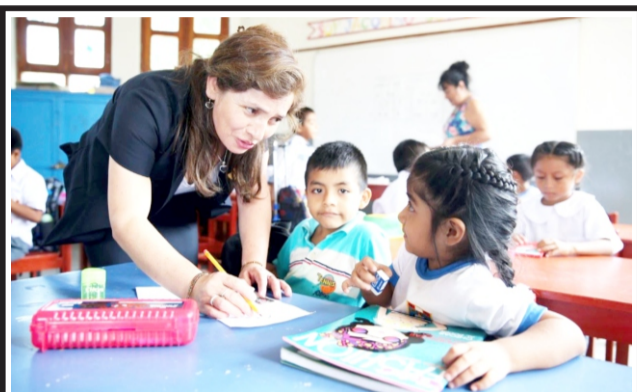
Por Día del Maestro