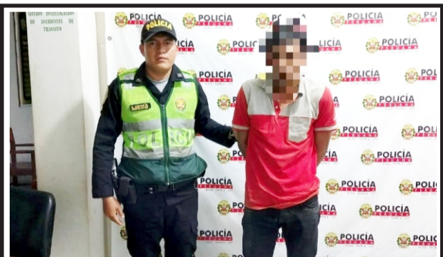
En el distrito de Jepelacio. Le dictan 7 meses de prisión preventiva