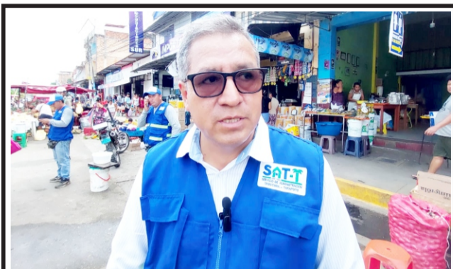
En zonas rígidas del barrio comercio en Tarapoto