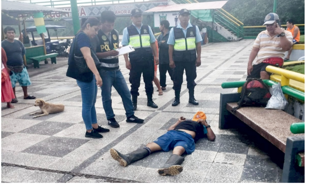
Aguaytía, el reside en la chacra ubicada en un caserío en el río arriba, y que se encon-

traba de paso por tratamiento del mal de salud que padecía, y precipitó su muerte,