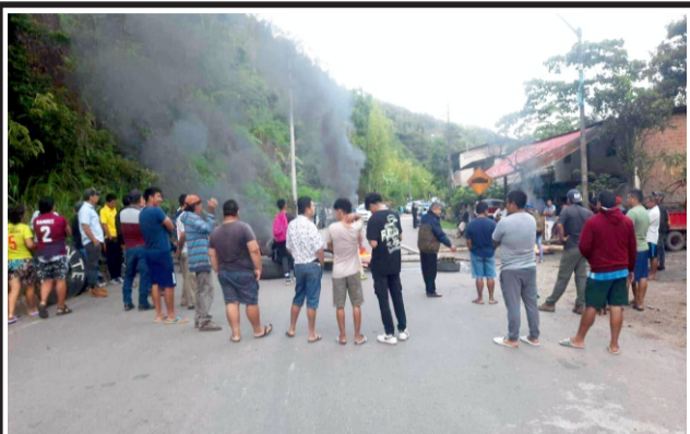
Pobladores de El Muyo protestan contra Electro Oriente