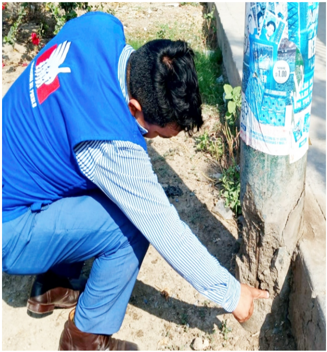
Pobladores del centro poblado Las Palmas