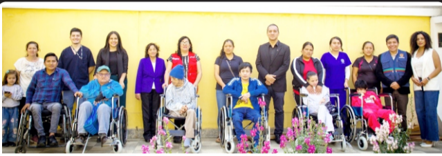
A personas de discapacidad en Chachapoyas