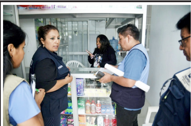
Por no contar con químico farmacéutico