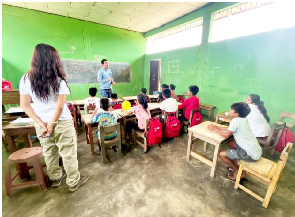
Lima, may. Más de 250 estudiantes de las comunidades nativas de Arutam, Fernando