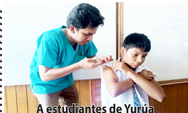
A estudiantes de Yurúa