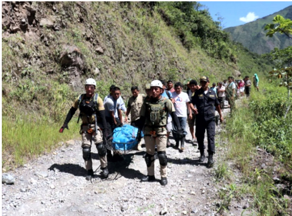
Pasco, may. En una mañana que debía ser de rutina, la tragedia sacudió a la comunidad de Buena Vista, en el sector de Río Blanco, carretera principal a la zona de Pozu-

zo, región Pasco, cuando una camioneta cayó a un abismo de 300 metros de profundidad y murió el conductor.