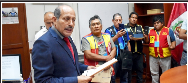
De todo el país