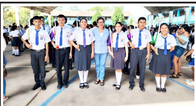
De la IE "La Paz" - Manantay