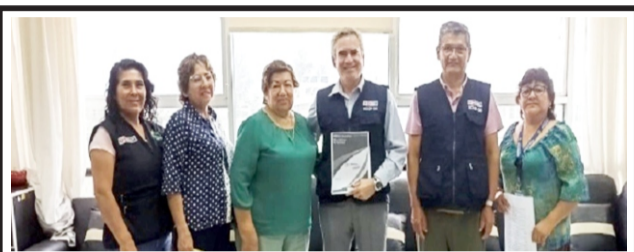
Consejo Nacional de Salud