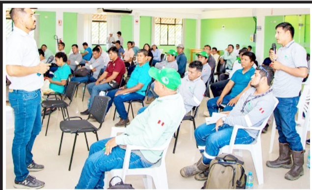
Con la marca "ASD Costa Rica"