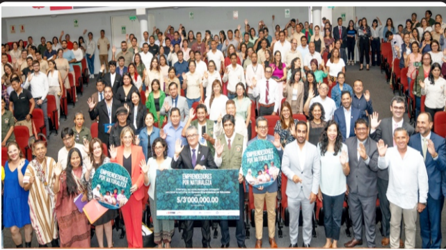
En Cordillera Azul, con S/ 600 mil soles financia emprendimientos