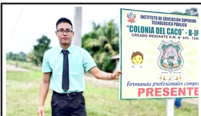
Con gastronomía y deporte celebra 78 años