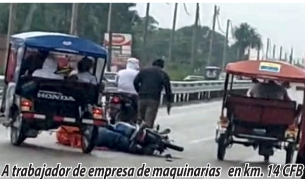
A trabajador de empresa de maquinarias en km. 14 CFB