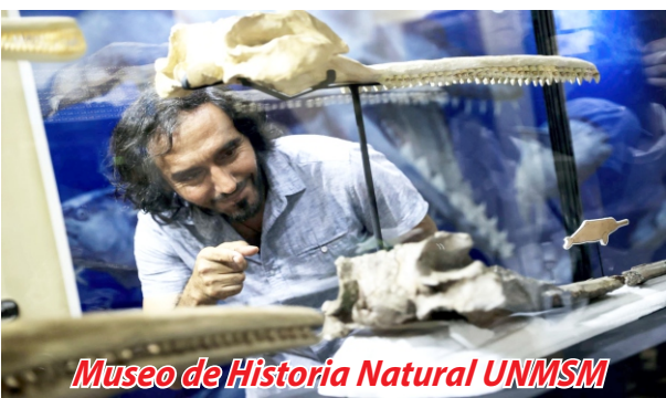
Museo de Historia Natural UNMSM