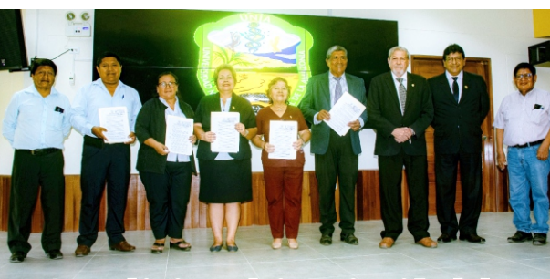
Cuyo objetivo es la investigación de las plantas que tienen propiedades medicinales