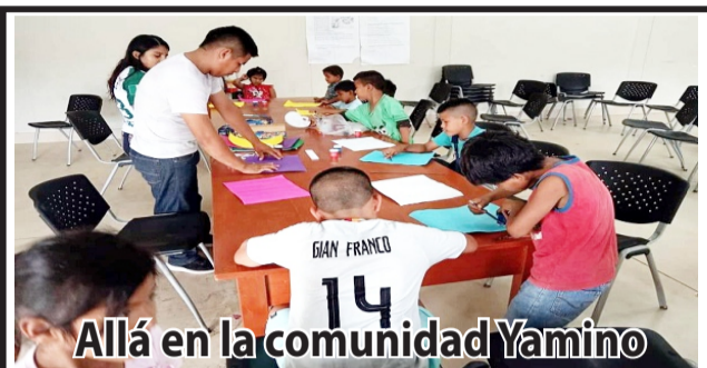
Allá en la comunidad Yamino