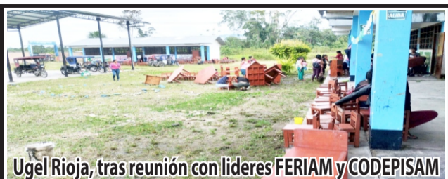
Ugel Rioja, tras reunión con líderes FERIAM y CODEPISAM