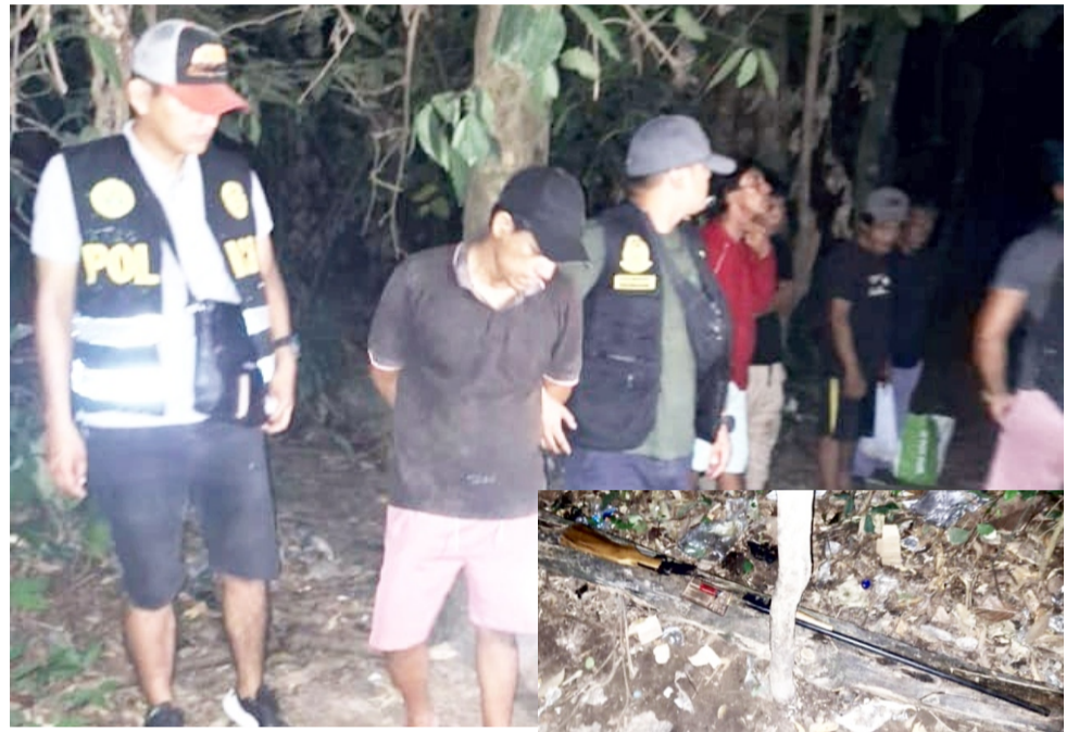
del Estado Peruano, el caso está a cargo del fiscal Víctor Hugo Del Castillo Coral, de la 3ra fiscalía provincial penal corporativa de Coronel Portillo. (D.Saavedra)

Ante las evidencias que los incriminaba, el personal policial interviniente los trasladaron a los cuatros sujetos detenidos junto al arma de fuego, los cartuchos y municiones incautados hasta la sede del Departamento de Seguridad del Estado-Pucallpa, dejándolos allí a disposición para las diligencias e investigaciones de acuerdo a ley, por encontrarse inmersos en el presunto Delito Contra la Seguridad Pública-Peligro Común, en la modalidad de Tenencia Ilegal de Arma de Fuego y Municiones, en agravio