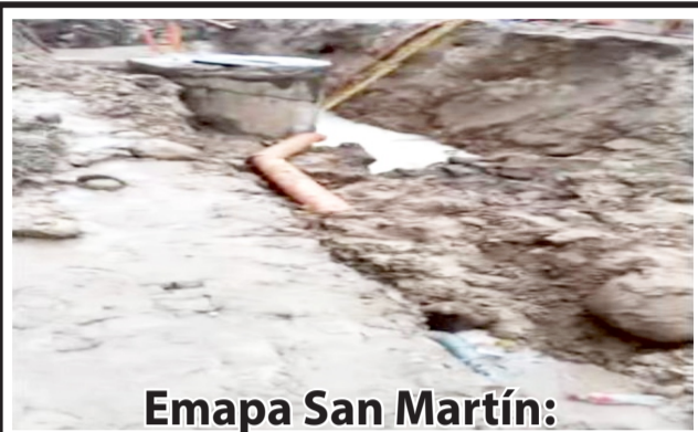
Emapa San Martín: