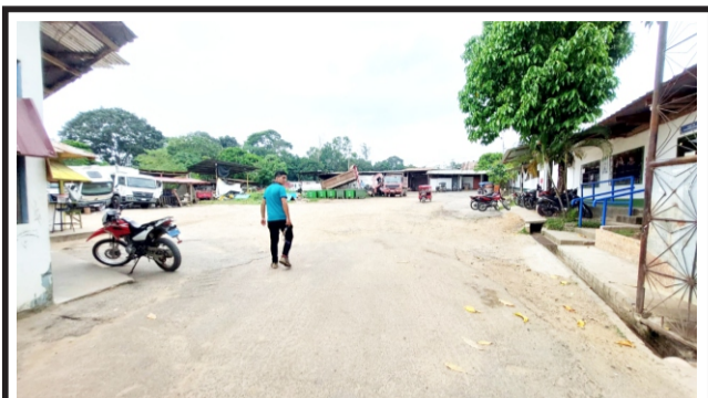
Para revalidar licencias de conducir para vehículos menores