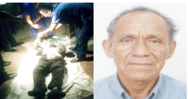
Ahogado en la quebrada "Linares" del caserío Unión Zapotillo