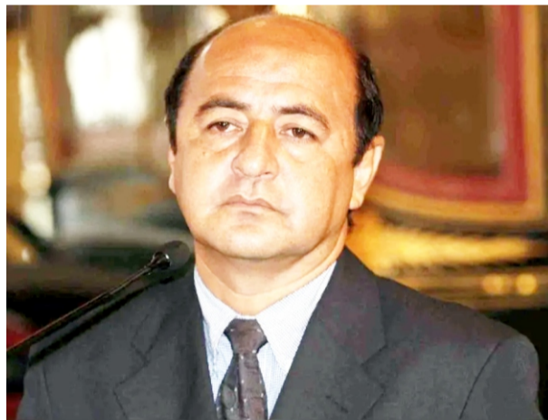
Exgobernador de Loreto