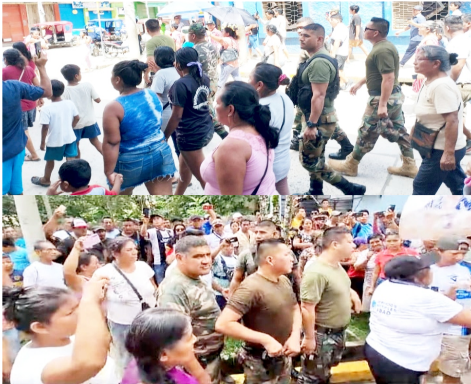
contingente policial del Escuadrón de Emergencia de Pucallpa viajó a la ciudad de Atalaya para controlar los disturbios.

habían salido, estando aún en horario de trabajo. Al parecer, se habían enterado lo que había sucedido con los efectivos policiales y por temor a ello abandonaron su centro de labores para ponerse a buen recaudo. Cabe indicar que, entre los manifestantes, hubo grupo de vándalos que realizaron pintas en las paredes de la comisaría de Atalaya. También quemaron llantas en el frontis, y en las otras dos sedes que administran justicia. Se conoció que un