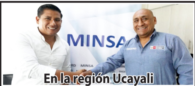
En la región Ucayali