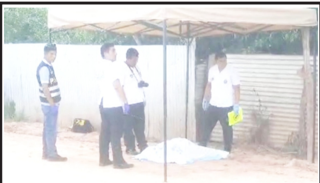
En caso de joven madre de 18 años asesinada a tiros