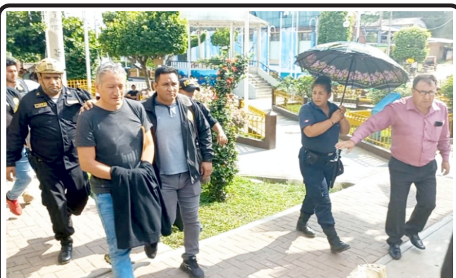
2 funcionarios y 2 empresarios fueron capturados: