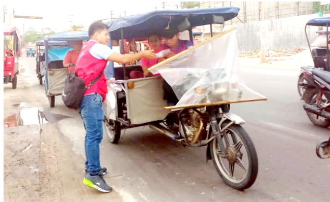
tes de su grupo familiar. Y como parte de las actividades, realizarón una Semaforización en la Av. José Abelardo

En el marco de las actividades para conmemorar el "Día mundial de la eliminación de la violencia contra la mujer" a realizarse el próximo 25 de noviembre, la Municipalidad Distrital de San Juan Bautista a través de la Instancia para prevenir, sancionar y erradicar la violencia contra la mujer y su grupo familiar adscrita a la gerencia de Desarrollo Económico e Inclusión Social conjuntamente con otras instituciones que forman parte de la Instancia de Concertación Distrital, viene participando de las actividades para prevenir la violencia contra la mujer y los integrantes