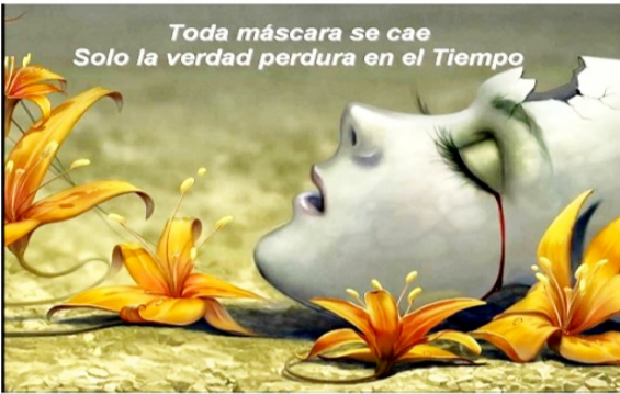
Toda máscara se cae Solo la verdad perdura en el Tiempo

Mi esposa aprendió a eludir sus responsabilidades mintiendo. Este mal comportamiento lo ha venido realizando durante mucho tiempo, y la mentira terminó convirtiéndose en un hábito que la domina en forma compulsiva. Cuando miente, ella obtiene cierto placer. Se siente de alguna forma más lista que los demás. El problema es que cada mentira, la une con otras nuevas. En los últimos meses, ha mentado para obtener dinero y hasta créditos bancarios. Lo único que ha conseguido es acumular deudas que no sabe cómo pagar. Estoy tratando de poner al descubierto sus mentiras, para tratar de "curarla" de esta onda perniciososa que ella niega en todos los idiomas. JAICO espera su ayuda para resolver este problema.