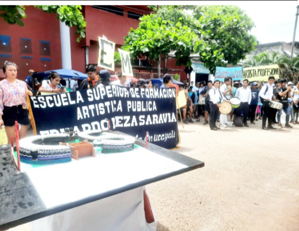
Estudiantes realizaron plantón en sede Goreu

Exigen licitar el nuevo local ESFAP "E. Meza Saravia"