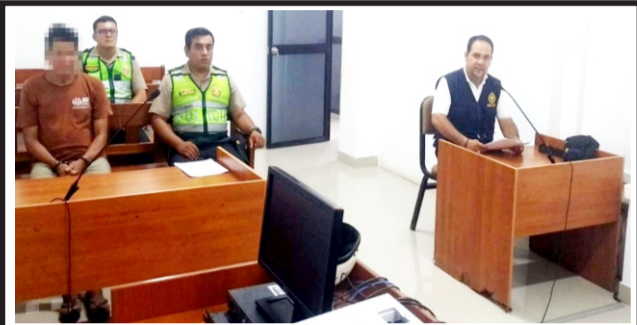
En El Dorado le imponen nueve meses de prisión preventiva