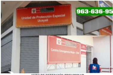
AUTO DE DETENCIÓN PRELIMINAR