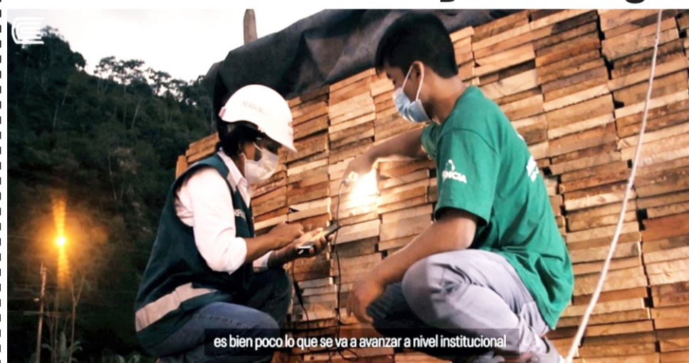
es bien poco lo que se va a avanzar a nivel institucional

Lima. El aplicativo móvil denominado MaderApp, que hace el reconocimiento de espe-