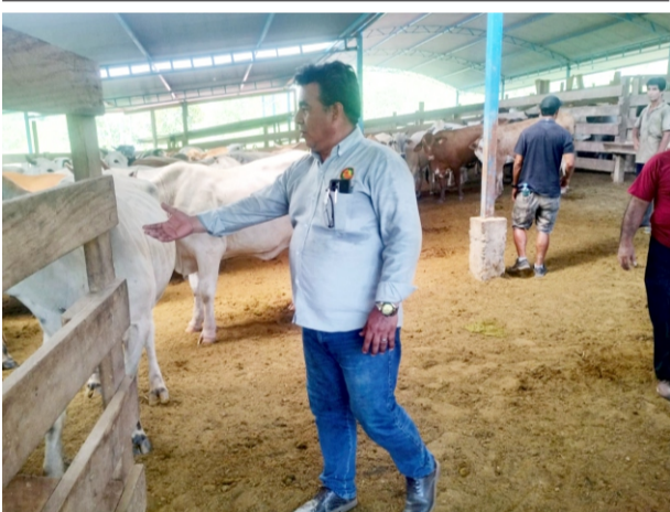
En el distrito de Sepahua