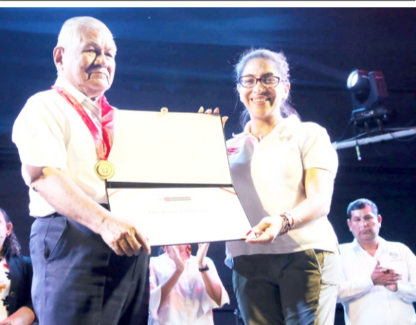
Como Personalidad Meritoria de la Cultura, en la Feria del Libro de Loreto