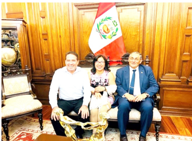
Pucallpa. El gas doméstico va tomando fuerza en la región Ucayali, luego de la reunión entre el gobernador regional, Manuel Gambini Rupay y el ministro de Energía y Minas, Óscar Vera Gargurevich, se anunció que el 17 de noviembre se fir-

mará el convenio que dará inicio al proceso de licitación para elegir a la empresa encargada de distribuir gas en miles de hogares ucayalinos. La reunión se realizó en la Sala de Embajadores de la sede del Congreso de la República, donde la autoridad regional logró que el ministro Vera se comprometiera a ejecutar prontamente la masificación, por lo que su visita en noviembre será crucial para sacar adelante el proyecto gasífero. Gambini, en lo que va del año, ha liderado diversas mesas de diálogo con el fin de llegar a acuerdos para el inicio del proyecto que, en una primera etapa, proveerá de gas natural proveniente del lote 31-C, situado en la ciudad de Aguaytía, a 2,000 hogares pucallpinos. Cabe mencionar que el proyecto gasífero incluye el diseño, financiamiento, construcción, operación y mantenimiento de sistemas de distribución de gas natural, que se tiene planeado replicar en los departamentos de Apurímac, Ayacucho, Cusco, Huancavelica, Junín, Puno y Ucayali. (FIN) NDP/JCB/MAO