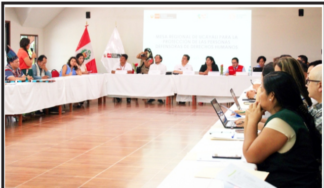
En el marco de la "Protección de las Personas Defensoras de Derechos Humanos"