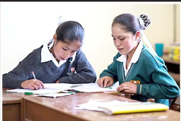
Congreso lo declaran de interés nacional