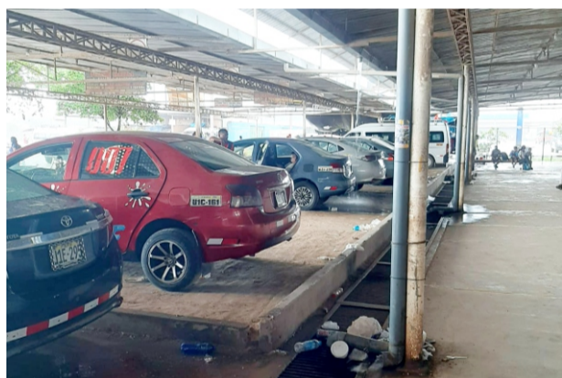
Transportistas de Pucallpa