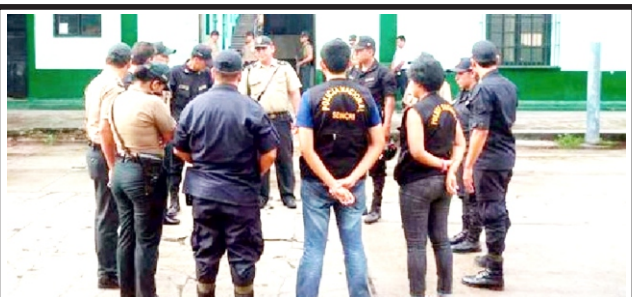
En frontera con Colombia, tras declaratoria de emergencia