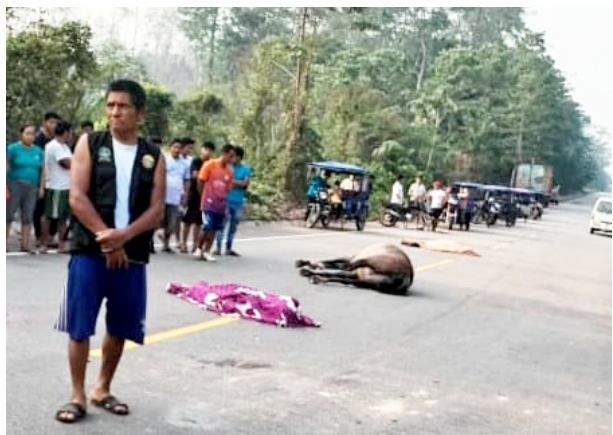
Hermanos perdieron la vida al igual que el animal en km28 CFB