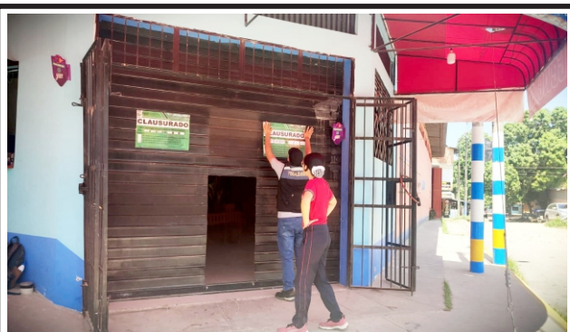
Durante operativo para verificar adecuadas condiciones de salubridad y uso de insumos naturales