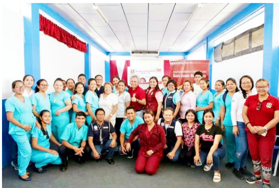
Salud - GERESA y todas las IPRESS de la jurisdicción, aquí se conoció que la impor-

Dicha reunión contó con la participación de la Gerencia de Desarrollo Económico e Inclusión Social de San Juan Bautista, Compromiso 1 SJB, Gerencia Regional de