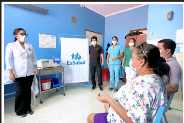
Gracias a equipos portátiles que permiten la atención ambulatoria