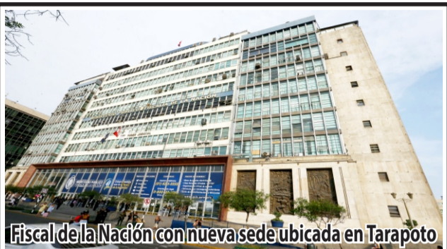
Fiscal de la Nación con nueva sede ubicada en Tarapoto