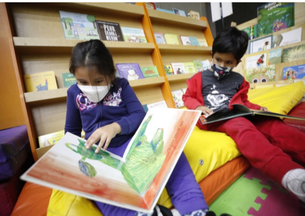
Ejecutivo aprobó proyecto de ley