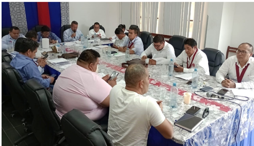
El Consejo Regional de Loreto, en sesión extraordinaria del martes 5 de setiembre, aprobó por unanimidad "Declarar en Situación de Emergencia a la Seguridad Ciudadana en la Región Loreto", por un plazo de 60 días calendarios, debido al aumento de víctimas de crímenes por encargo, sicariato y homicidios.

Del mismo modo, se aprobó por mayoría, con la dispensa de la Comisión de desarrollo social, el "Plan de Acción Regional de Seguridad Ciudadana Loreto 2023", que tendrá vigencia en todas las provincias y ámbitos de la región Loreto.