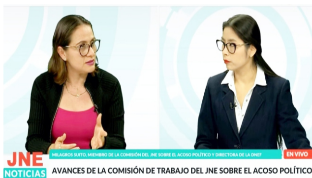
JNE NOTICIAS AVANCES DE LA COMISIÓN DE TRABAJO DEL JNE SOBRE EL ACOSO POLÍTICO EN VIVO

De igual manera, plantea modificar la Ley de Organizaciones Políticas para establecer medidas internas y sanciones ante eventuales incumplimientos por parte de las organizaciones políticas, así como establecer correcciones y precisiones dentro de la propia Ley N° 31155.