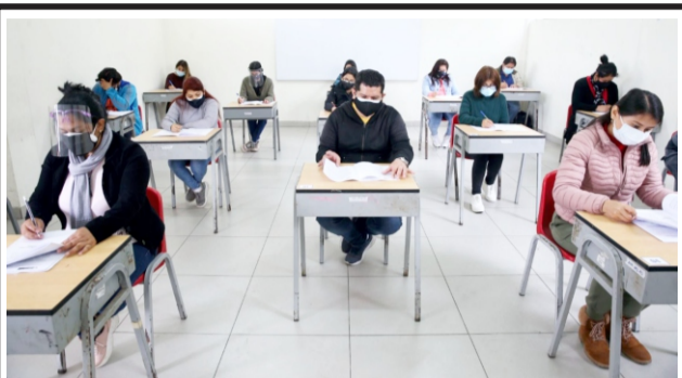
En nombramiento de profesores