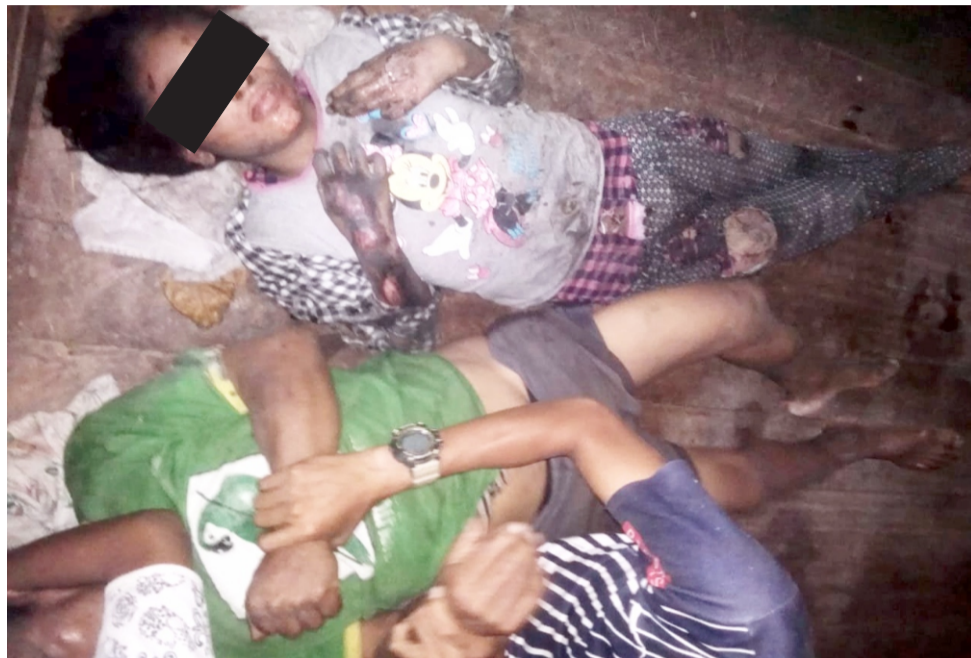
ra ello puede comunicarse al número 944012596 o acudir al área de quemados del HRP, donde puede ubicar a los pacientes en estado de recuperación.

controlado, y las llamas se apoderaron de todo el sector. "Toda mi familia estaba haciendo los trabajos para controlar el fuego. La caída de un árbol muy cerca, hizo que mi hija lleve la peor parte y hoy nos piden medicamentos, ya que ella está internada en cuidados intensivos del Hospital Regional", explicó la madre de familia. La familia viene solicitando apoyo, a las autoridades y vecinos de buen corazón, pa-