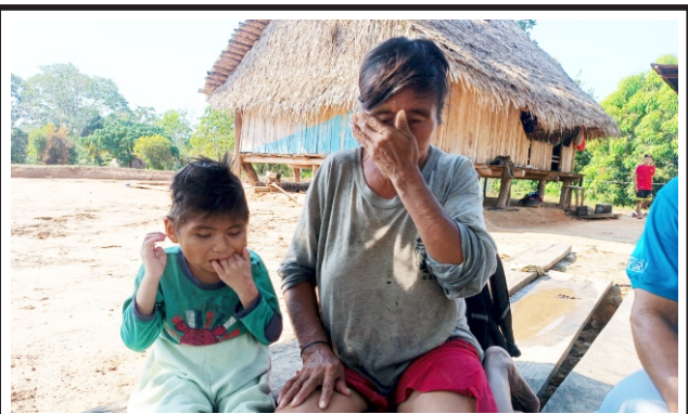
Niño Ashéninka perdió la visión