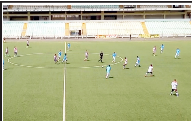
Muchos goles, pero poco fútbol en esta fecha