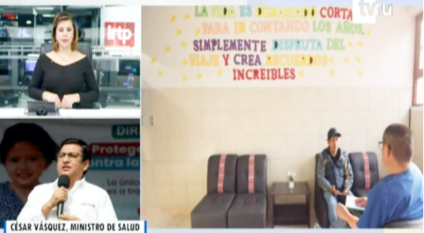
INAUGURAN PRIMER CENTRO DE SALUD MENTAL COMUNITARIO EN REGIÓN APURÍMAC

Gratuitamente, priorizando adultos mayores y menores