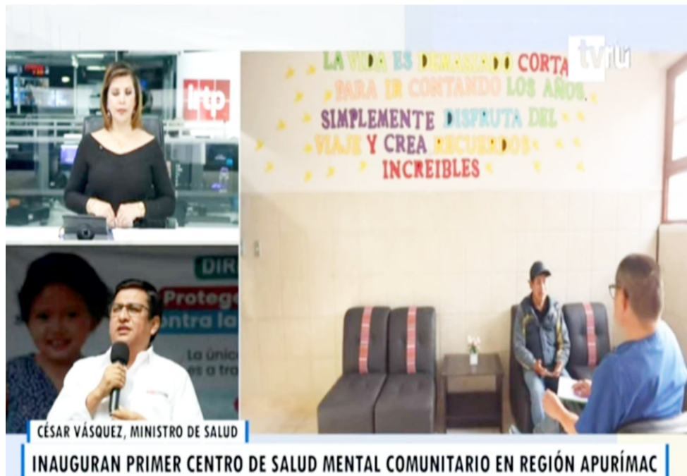
CÉSAR VÁSQUEZ, MINISTRO DE SALUD