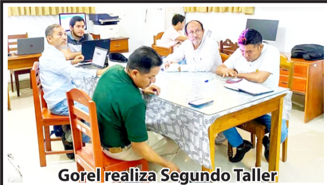
Gorel realiza Segundo Taller